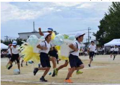
<4年生：追っかけ玉入れ>