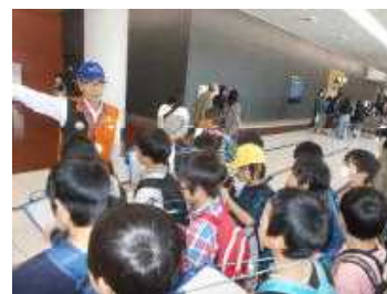
↑ 【セントレア】 ← 【明治なるほどファクトリー】