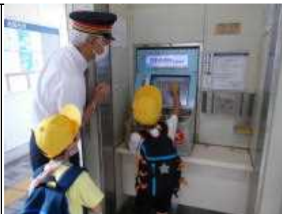
<2年生:電車に乗ったよ>