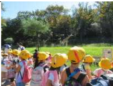
<1年生:キリンと一緒に>