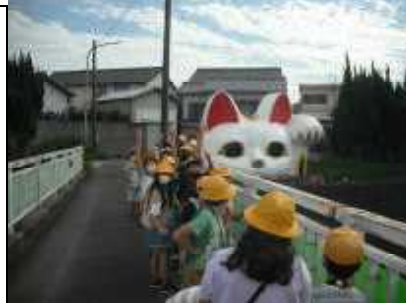
<4年生:常滑焼の招き猫>

●ライオンを見にいきましたが、ねていました。ざんねんでした。あつかったし、つかれていたのかな。つぎに見に行くときには、ほえているところを見たいです。 (ORさん)