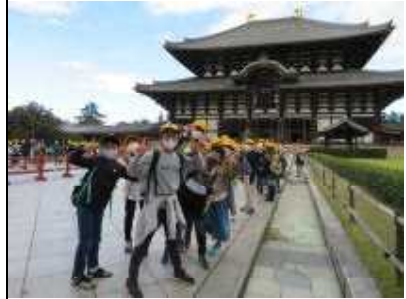
<奈良・東大寺大仏殿>