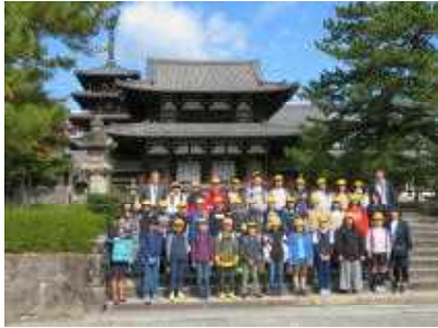
<奈良・法隆寺で記念撮影>

10月20日(水)・21日(木)に6年生が奈良・京都に修学旅行に行ってきました。コロナ禍の中、実施が心配されましたが、今年は予定通り実施できました。