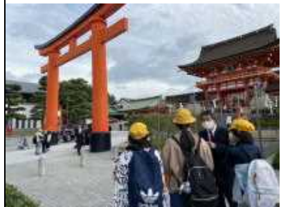
<京都タクシー研修>