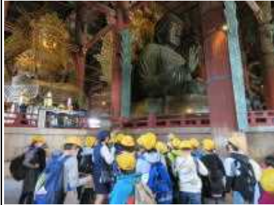
<奈良・東大寺の大仏>