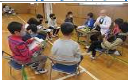
4年生:総合的な学習 「職業人から話を聞く会」

●医師や美容師、漫画家やサッカー選手など13の職業の方に来校していただきました。仕事の内容や大変なこと、やりがいなどをインタビュー形式で教えていただきました。将来に向けて、大きな夢を描くことができました。