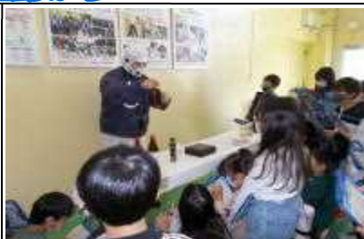
3年生:校外学習 「ありがとうの里」(碧南市)

●医師や美容師、漫画家やサッカー選手など13の職業の方に来校していただきました。仕事の内容や大変なこと、やりがいなどをインタビュー形式で教えていただきました。将来に向けて、大きな夢を描くことができました。