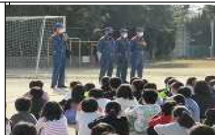
全校 火災避難訓練

●だし工場の見学に行きました。「ありがとう」という言葉をかけながら作ると、おいしいだしができるそうです。「ありがとう」などやさしい言葉をたくさん使うようにするとよいことを教えてもらいました。