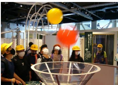
5年生 名古屋市科学館