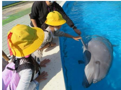
2年生 ビーチランド