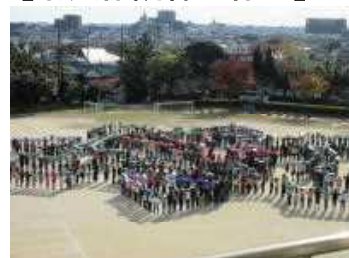
【航空写真撮影の様子】

本校では、大正4(1915)年より毎年、児童の作文集「成岩学林」を発刊しています。戦中・戦後(昭和16年～昭和25年)の休刊はありましたが、本年度100号を発刊することになりました。その記念として、航空写真および全校集合写真の撮影をしました。