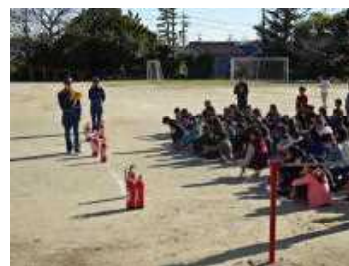
【消火器訓練の様子】

11/9～15の全国火災予防週間に合わせ、成岩小学校でも火災避難訓練を行いました。火災の場合は、火だけではなく大量に発生する煙から命を守ることも必要です。4・5年生は濃煙体験を、6年生は水消火器で初期消火の訓練も実施しました。