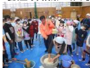
【もちつき大会の様子】

これも米作りでお世話になった農業委員の方や、もちつき大会でお手伝いいただいたPTA役員、学校運営支援協議会委員、保護者、地域の方々のおかげです。ありがとうございました。