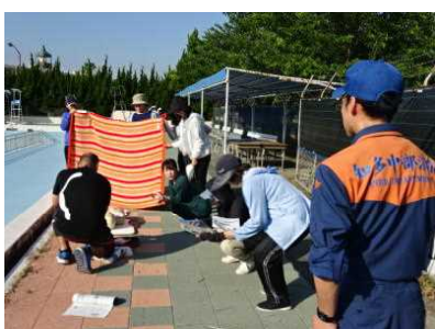
水泳の授業の様子